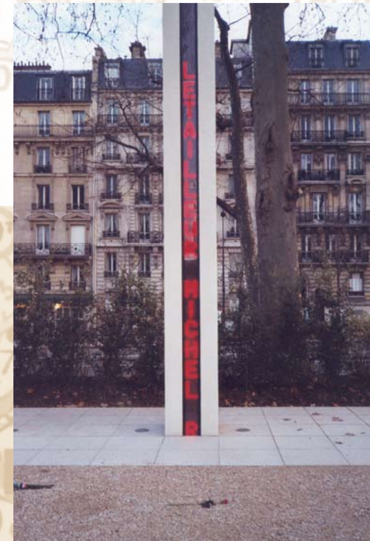
Quai Branly à Paris