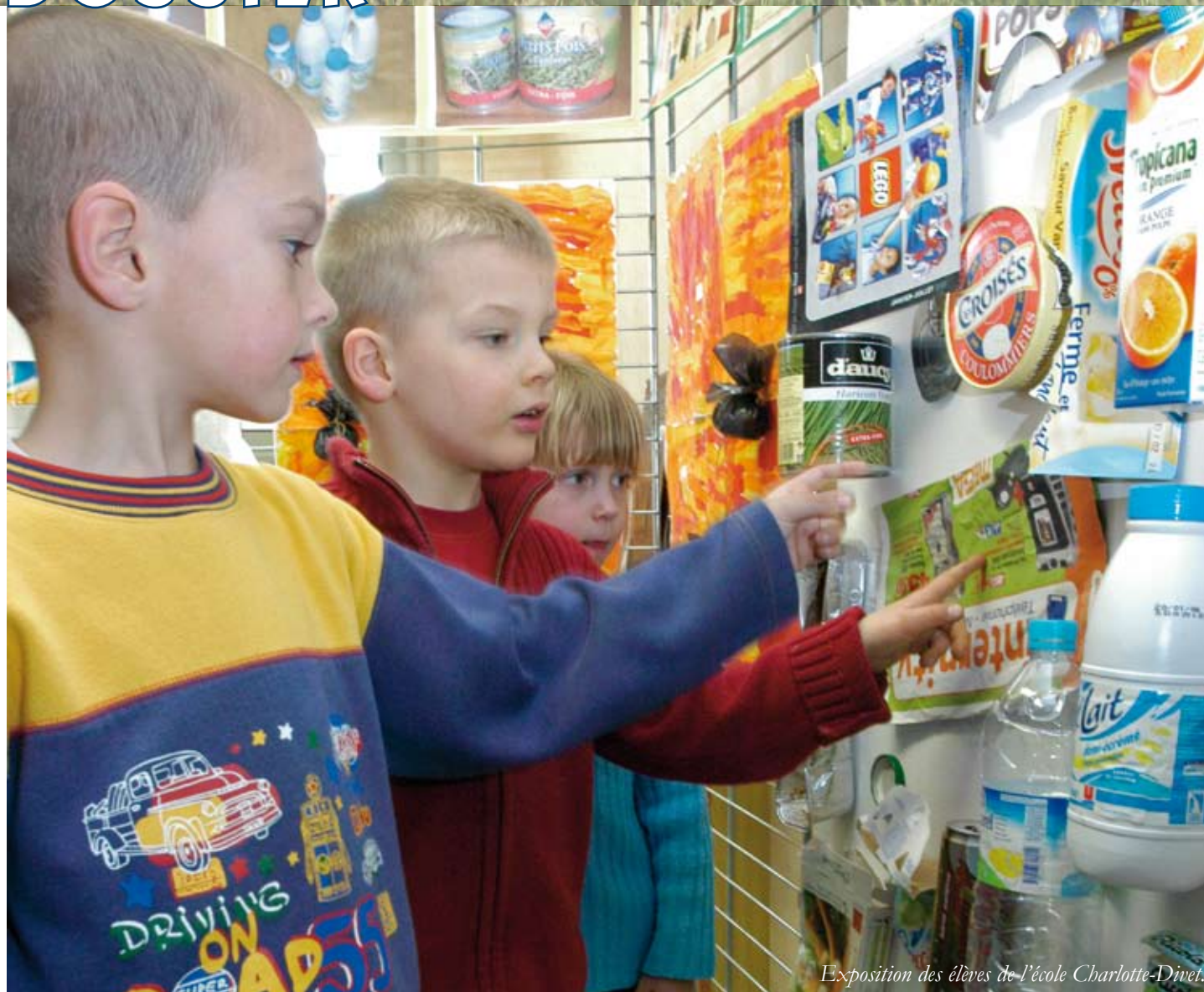
Exposition des élèves de l'école Charlotte-Divet.